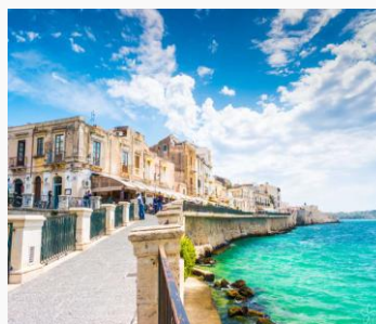
ISOLA DI ORTIGIA